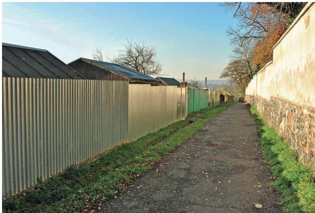
Košíčka pod Bulovkou

lem. Zde je místo pro otázku, jestli by bylo rozumné z osad místo pro legální bydlení učinit (například jako Vídeň)? Bylo by patrně pro všechny zúčastněné lepší, kdyby k tomu dojít nemuselo a město řešilo situaci jinak.