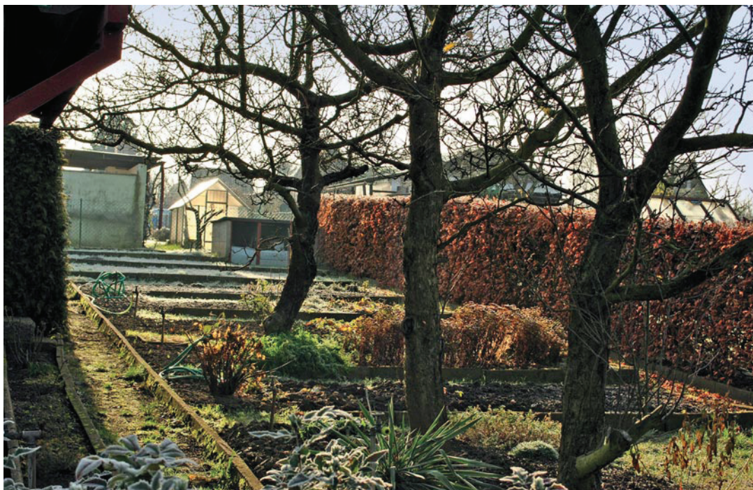
Jahodnice v Kyjích