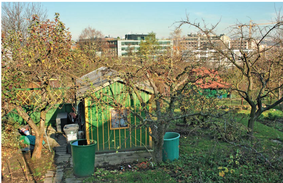
Ořechovka s novými administrativními budovami v Dejvicích