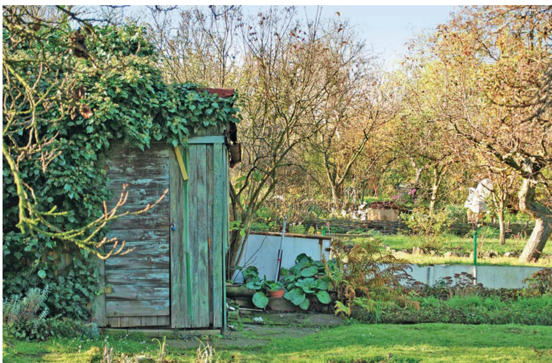
Ořechovka v Dejvicích

zamotaných problémů... Nebylo by správné se o nich nezmínit.