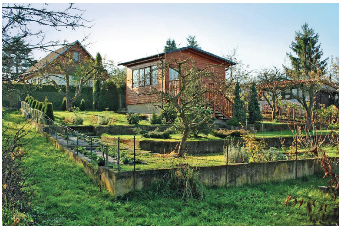
Jenerálka v Praze 6

K zahrádkaření v osadách už tak nějak patří snaha leccos vyřešit pokud možno co nejlevněji. Nové využití odpadních materiálů je v podstatě moderní a ekologické. Estetika vznikající touto snahou má dvě strany mince. Z využití odpadních materiálů může vzniknout svérázné půvabné dílko (často připomínající i současné moderní umění), nebo způsobí to, že osada začne připomínat slum nebo skládku. Druhý z případů se většinou odehrává tam, kde se jedná o čisté hromadění věcí, které „se mohou hodit“ – tedy o využívání zahrádky jako skladiště harampádí, a netýká se jen osad opuště-