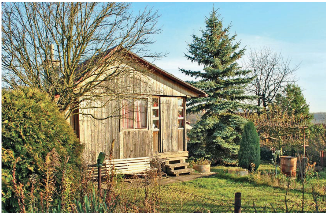
Osady v Suchdole