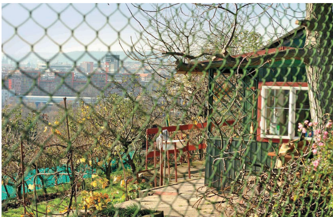
Košinka pod Bulovkou s novou výstavbou v Holešovicích v pozadí

pobyt v nich do značné míry znemožňuje. Nelze pominout ani fakt, že mnohé osady se nacházejí na místech pro park nevhodných, argument může být pak použit především jako mezikrok pro zrušení osady (vzhledem k současnému vývoji je následné založení skutečného parku více než nejisté).